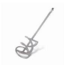
不銹鋼電動攪拌器